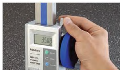
Большой зажимной рычаг