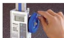
Большой плавный маховичок