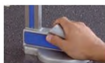
Подходит по размеру руки